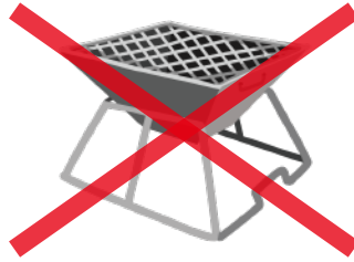
・脚の長さが 50cm以下の器具 ・焚き火台